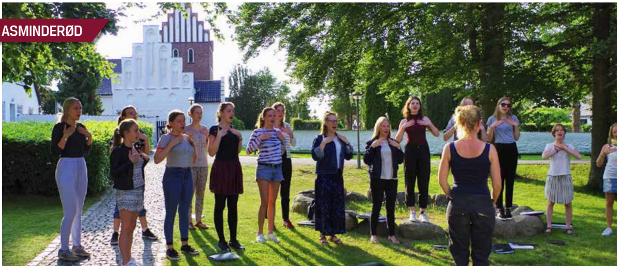
Fredensborg Slotskirkes Pigekor øver i aften-solen til en koncert i Humlebæk Kirke.