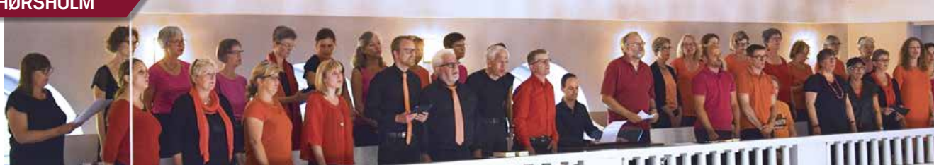
Gæstekor fylder Hørsholm Kirke med stemning ved en af årets 180 gudstjenester.