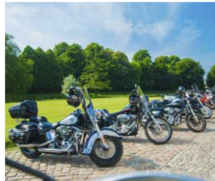
Bikergudstjeneste med religiøse rygmærker og kristne bikes er blandt initiativerne i Hørsholm Kirke.