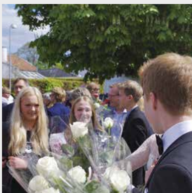
Med omkring 120 til gudstjenesterne hver søndag og et tilsvarende antal konfirmander om året er der mange smil i Rungsted kirke.

Det handler om at bruge de økonomiske midler og ressourcer så effektivt som muligt under hensyntagen til det overordnede mål. Jo dygtigere vi i menighedsrådet er til fra kulissen at sikre økonomi og projektledelse, desto større arbejdsro og spillerum har præsterne,