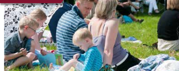
Karlebos kommende menighedsråd kommer til at barsle med nye børneinitiativer.