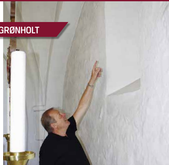
Kirkens revner er et fast punkt på agendaen.

en stadig udfordring. Jorden sætter sig, og det har den gjort altid. Derfor er for mange år siden bygget en støttemur mod øst. Alligevel er det en stadig udfordring at holde muren ved lige og udbedre de revner, der dukker op hvert år. Men vores kærlighed til kirken er stor, og det er én af menighedsrådets største opgaver at sikre, at den altid står smuk og velholdt her på sin høj i Grønholt.