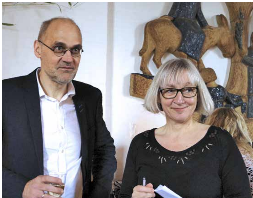
Humlebæks 2020 vision drejer sig om at støtte de to vellidte præsters store indsats.

menighedsplejen og de mange frivillige, der gør en kæmpe indsats her i sognet. Vi planlægger kirkens aktiviteter for et år ad gangen. Det betyder større kontinuitet og mere ro til at håndtere de muligheder og udfordringer, der altid dukker op. Vi er et godt team i det nuværende råd, men vil i forbindelse med valget gerne tilføre rådet kompetencer inden for kunst og kultur, samt økonomi, byggeri/teknik og kommunikation.