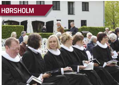
Hørsholms og Rungstedts præster på stribe før det går løs ved den fælles pinsegudstjeneste.