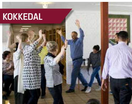
Velkomstmiddag for flygtninge endte i dans.