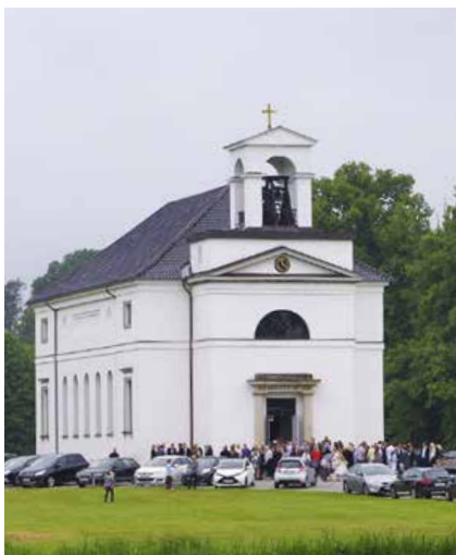
Hørsholm kirke er valfartskirke, der tiltrækker mange uden for sognet.

Flere af de nuværende menighedsrådsmedlemmer har, efter flere års indsats, valgt at stoppe ved udgangen af denne valgperiode. Derfor er der brug for og plads til nye medlemmer, der har lyst til at gå ind i arbejdet. Arbejdsbetingelserne for det kommende menighedsråd har aldrig været bedre end nu. Vi har en velfungerende organisation,